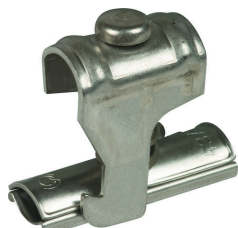
Az ábrák nem kötelező érvényűek